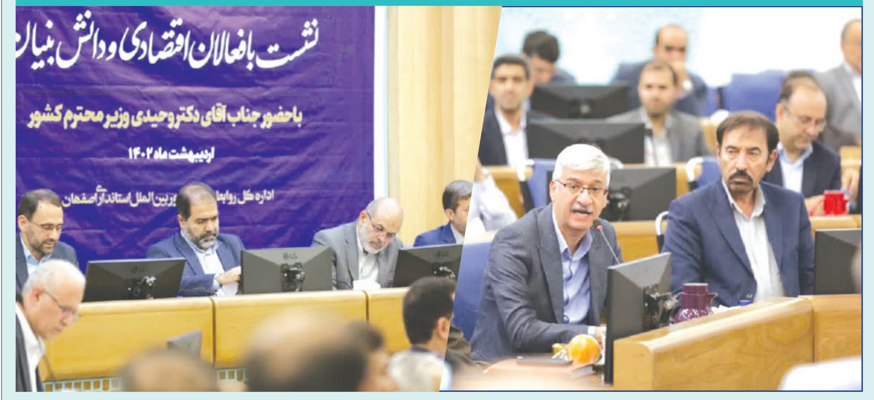
نشست با فعالان اقتصادی و دانش بنیان اردیبهشت ماه ۱۴۰۲