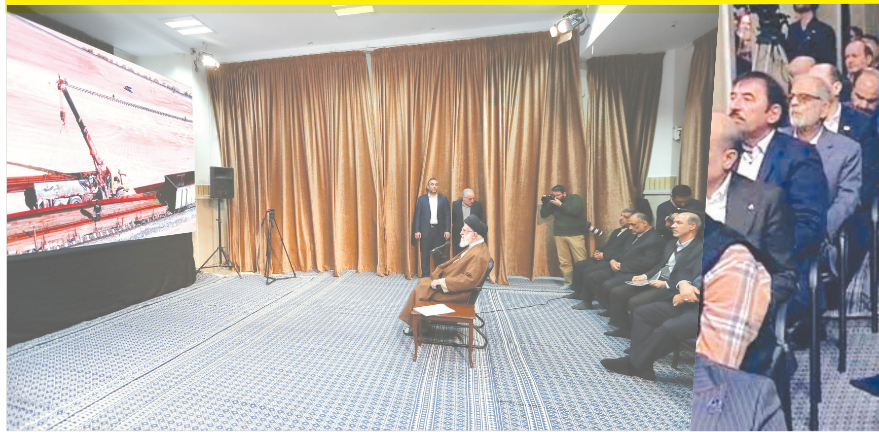
بازدید از نمایشگاه توانمندی های تولید داخلی: بارانداز ترکیبی ریلی شرکت به تاش سپاهان در بازدید از کارگاه توانمند پهای کار آفرینان و فعالان اقتصاد دانش بنیان ی کشور در تاریخ ۱۴۰۲/۱۱/۹