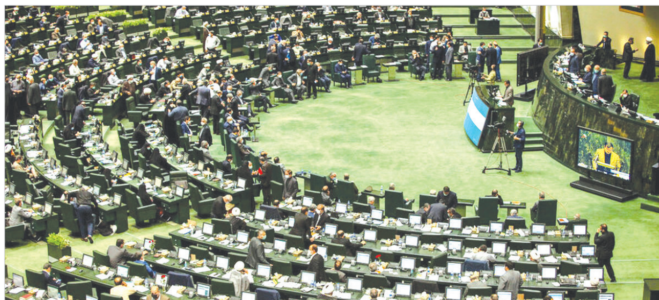
نمایندگان مجلس شورای اسلامی در جریان رسیدگی به لایحه برنامه هفتم توسعه کشور در بخش مدیریت گذر (ترانزیت) دولت را مکلف کردند تا با هدف ارتقای

جایگاه کشور در بازار تولید و تجارت جهان و افزایش سهم بری از زنجیره‌های ارزش منطقه‌ای و جهانی بر اساس مزیت نسبی مناطق مختلف کشور، سند پیشرفت شبکه یکپارچه فرآوری و ترابری (شیفت) را تهیه کنند. به گزارش ایسنا، نمایندگان مجلس شورای اسلامی در جلسه نوبت صبح امروز (یکشنبه) مجلس و در جریان رسیدگی به گزارش کمیسیون تلفیق در خصوص برنامه هفتم توسعه جمهوری اسلامی ایران با الحاق بند زیر به بند ماده ۵۷ این لایحه به شرح زیر موافقت کردند. الحاقی - دولت مکلف است حداکثر تا شش ماه پس از ابلاغ این قانون، با هدف ارتقای جایگاه کشور در بازار تولید و تجارت جهان و افزایش سهم بری از زنجیره‌های ارزش منطقه‌ای و جهانی بر اساس مزیت نسبی مناطق مختلف کشور، نسبت به تهیه سند پیشرفت شبکه‌ی یکپارچه فرآوری و ترابری (شیفت) و سیاستگذاری لازم جهت تشویق و حمایت از بخش خصوصی و راه‌اندازی زنجیره‌های ارزش با اولویت مناطق محروم کشور اقدام کنند.